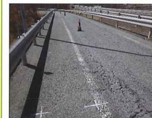
舗装損傷状況 現状

安全・快適に高速道路をご利用いただくために必要な工事ですので、ご理解とご協力をお願いいたします。