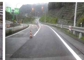
舗装補修完了イメージ